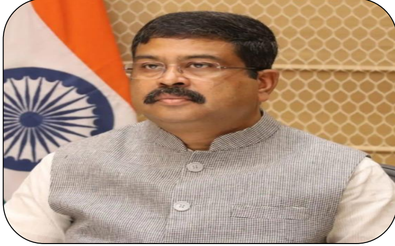
SH. Dharmendra Pradhan, Education Minister श्री धर्मेन्द्र प्रधान, माननीय शिक्षा मंत्री