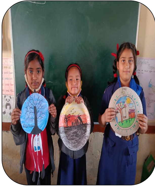
PAPER PLATE PAINTING